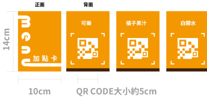
圖 3：加點項目卡，實際內容依當天公告為主