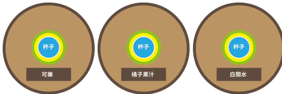
圖 5：加點項目卡裝盤示意圖，實際內容依當天公告為主