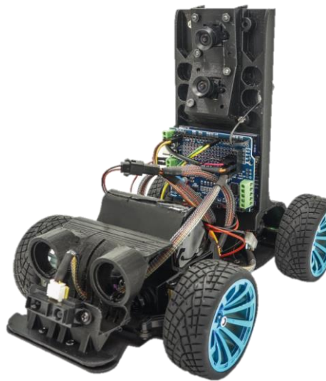
旗標科技公司的『F-Drive AI 自駕車整合教學系統』